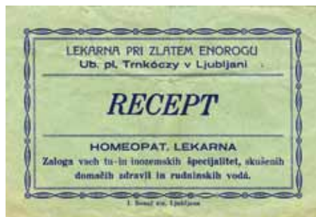
Ovojnica za recepte (Mestni muzej Ljubljana)