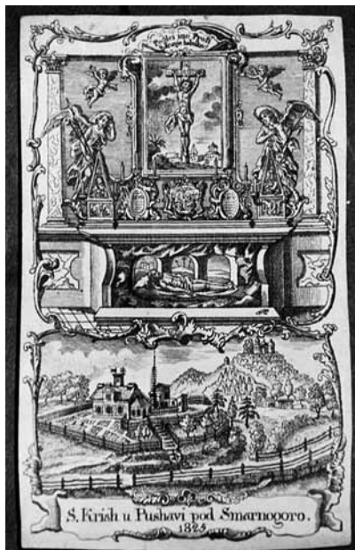
Podobica z Gradiškovo hišo pod Šmarnogoro, 1825 (Mestni muzej Ljubljana)