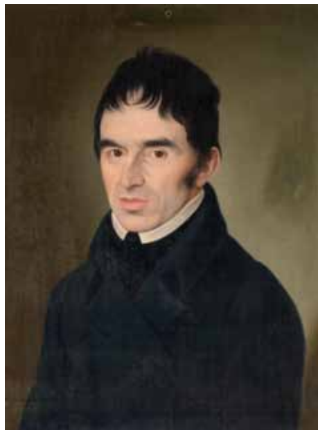
Matevž Gradišek (avtor Matej Langus, 1. pol. 19. stol., Narodni muzej Slovenije)