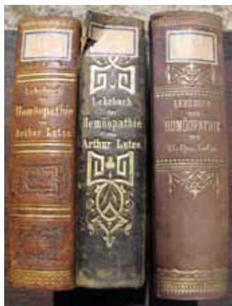
Homeopatski priročniki Arthurja Lutzeja, Francišksanski samostan Novo mesto