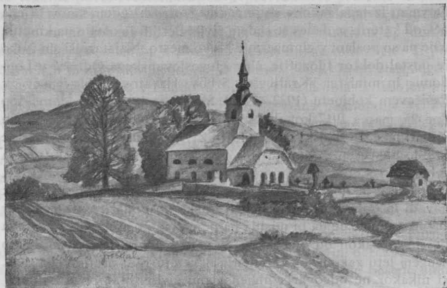
Griblje: Cerkev sv. Vida

Kot šestnajstletno dekle je začela delati po polju z motiko in srpom. Le včasih je bilo vsakdanje delo in monotono življenje prekinjeno s pohodom k maši in v vinograd na Plešivici, kjer imajo Gribeljci svoje zidanice. Pri kohanju in prašenju spomladi in na jesen ob trgatvi se je pelo in vriskalo, da je gora zvonila in