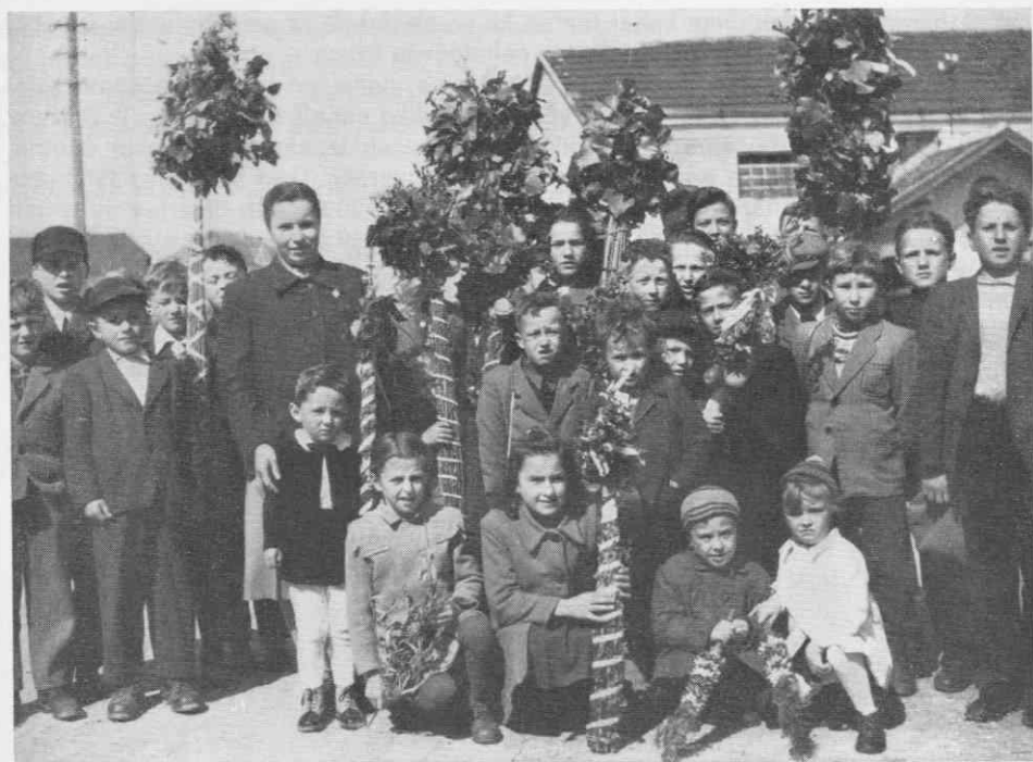
Slika 6. Ljubljanski butarici med dolensjkimi »pušlji« v Mokronogu. Foto Marija Jagodic, 1954