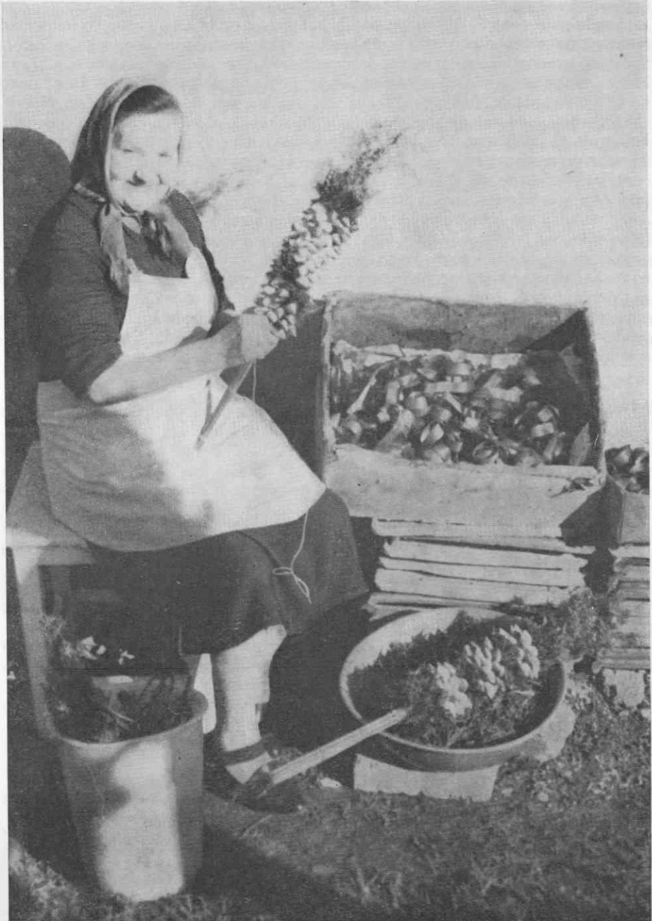
Izdelovalka butaric iz Skaručne pri delu. Foto Ljudmila Bras, 1967