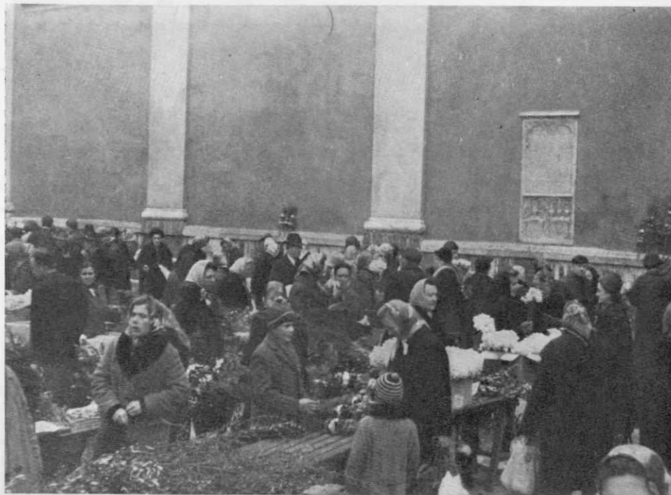
Slika 5. Vrvež kupcev in prodajalcev butaric na cvetno soboto na ljubljanskem trgu. Foto Ljudmila Bras, 1967

V zadnjih letih se je prodaja butaric občutno povečala. To so izkoristili predvsem mlajši ljudje, ki si ustvarjajo dom. Pričeli so izdelovati butarice kar na veliko. Zveči-