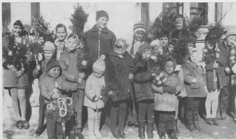
Slika 7. Ljubljanska butarica med »prajklji« v Kranjski gori., 1967