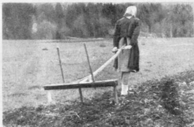
Paranje zemlje in napravljanje riž z ročnim črtalom. Mała horna 1957