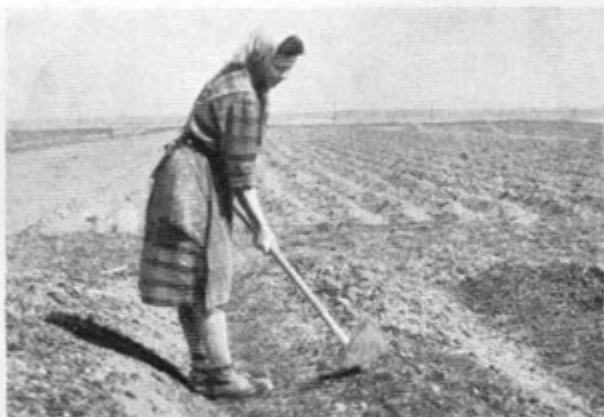
Naprava ogofov in rahljanje zemlje z motiko na Dravskem polju pred sajenjem krompirja. Sp. Jablane 1957