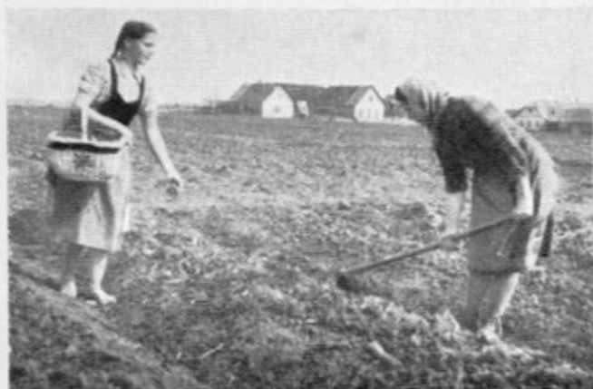
Sekanje zemlje in sajenje krompirja >pod motiko< na Dravskem polju. Sp. Jablane 1957