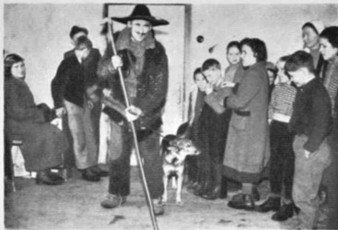
Nastop pastirja v »Pastirsko - trikra- ljevski igri« v Me- žiški dolini (Sentanel 1958)