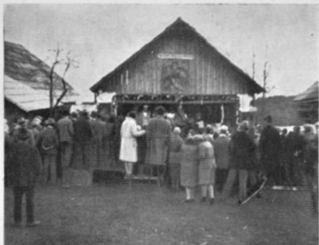
Leseni oder »pi- nja« pri Zoanu na Kostanjah. - Pred predstavo