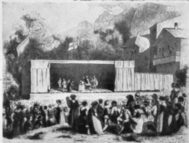
Gledališka pred- stava v Staldenu v Soici 1842. (J. Ber- trand, Le Théâtre pop. en Valais. — Arch. suisses des Trad. pop. 1951)