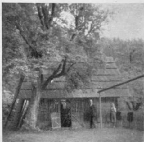
Stavba, kjer je nameščena manga — pri Valharju ob Libiji