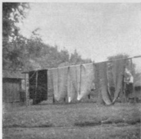
Valjalec suši bukovino in raševino