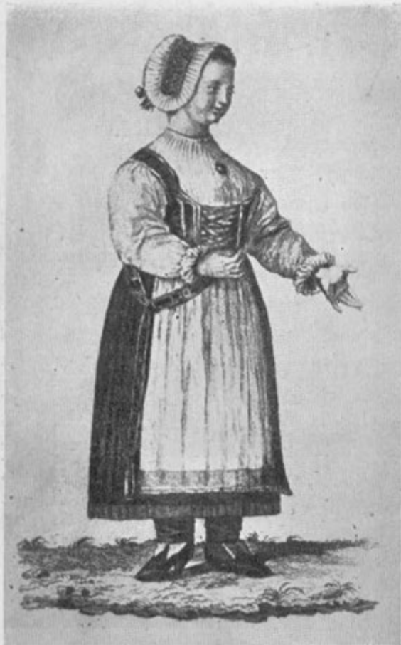
15. Kranjica (po Hermannu, 1780)