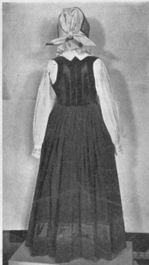
16. Krilo z modrcem iz gorenjskega kota Rateče—Planica (iz zbirke Etnografskega muzeja v Ljubljani)