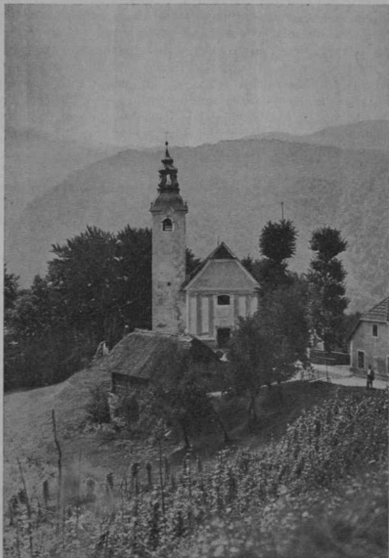
Draga Marija na levem bregu Save pri Hrastniku, kjer se nahajajo grobovi starih Rošev

Ne pretiravam, ako rečem da je bilo od Možinata pa do Zagorja čez 3000 ljudi na delu. V taistem razmerju je bilo na poslu tudi mnogo voznikov; vozili so gradbeni material, kamen iz kame-