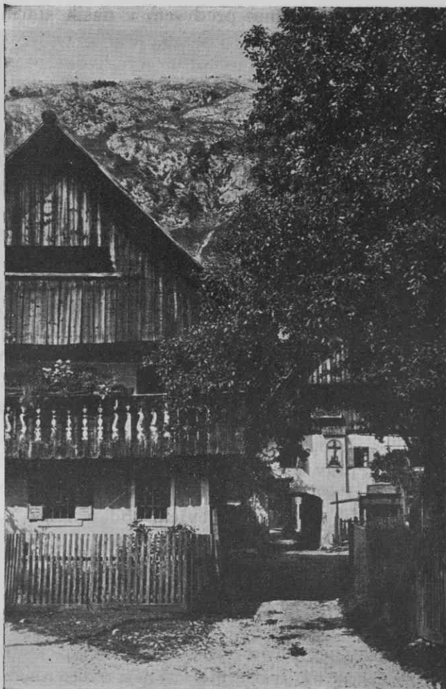
Sl. 1. Gorenjska hiša