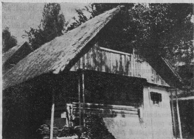
Sl. 3 Hiša v Homcu pri Kamniku