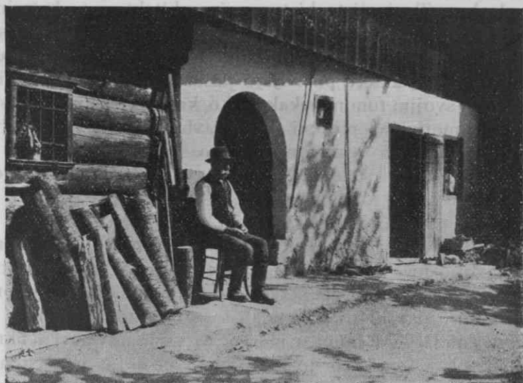
Sl. 2. Vhod v kmečko hišo