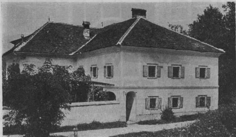
Sl. 5. Hiša pri Kamniku

Kolikor je konstruktivno lesovje, kakor špirovci, lege, stropniki itd., pri napuščih vidno, ni okrašeno, temveč tvori že samo po sebi za nas dovolj ukrasno členkovitost s svojim naravnim ogrođjem. Leseni hodniki, ki so pri hišah bodisi lepotnega, bodisi porabnega pomena, so polepšani na nekaterih posebno vidnih mestih z izrezljanimi deščicami. Sl. 1. Toda le-té niso reliefno ali pa vedno tako izrezane, da bi bila deščica potem okrasni motiv v