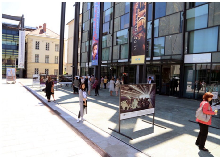
Odprtje razstave Nacionalni muzeji Slovenije