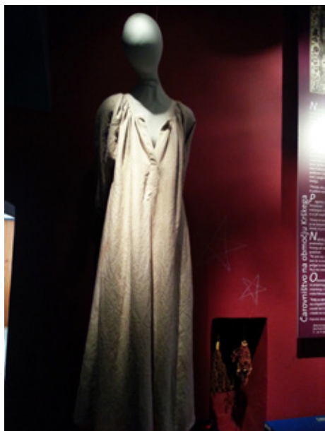
Rekonstrukcija obleke, v kakršno so med procesom oblekli čarovnico, Mestni muzej Krško