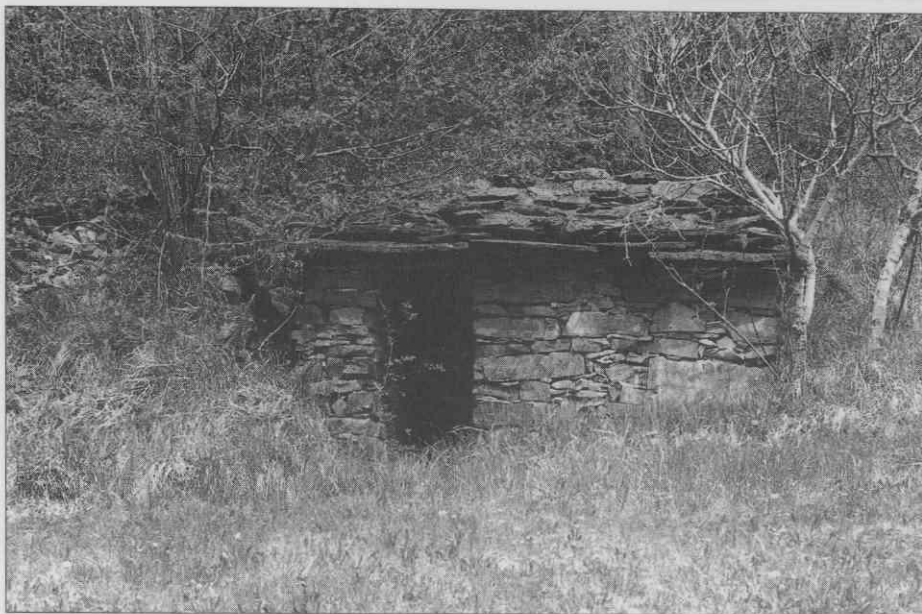
Orehovica - zavetišče v dolini Pasjega repa. ♦ Orehovica - shelter in the Pasji rep Valley. ♦ Orehovica - abri dans la vallée de Pasji rep.

škrlj/, mlajša pa že iz večjih odbranih kosov lokalnega kamna. Prva imajo tudi ostreže iz skrl, druga pa so krita že s korčno kritino.