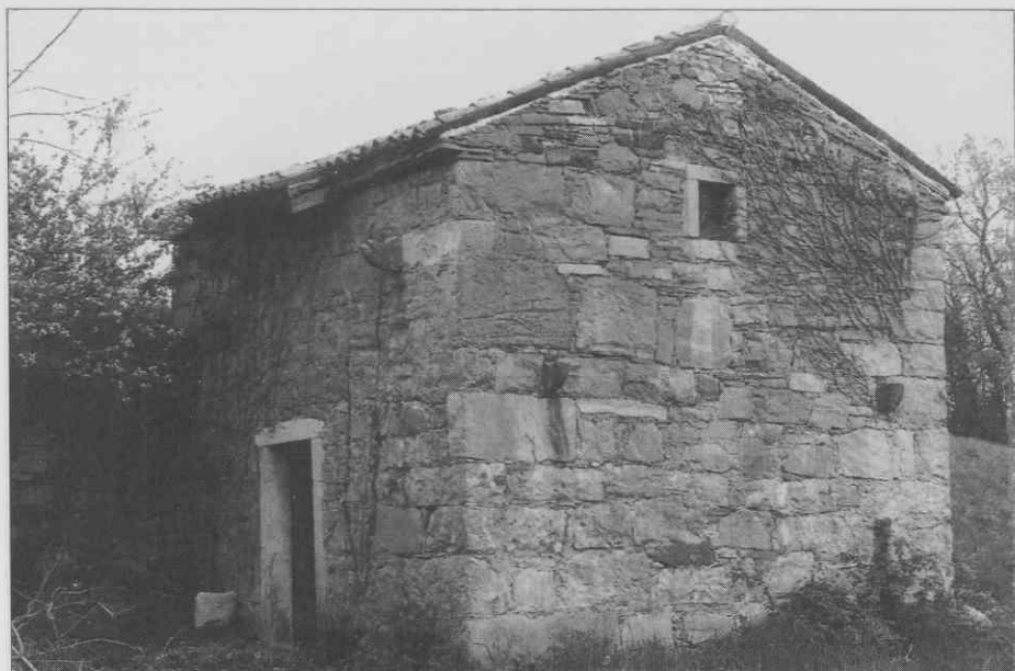
Slap - Bizjak - Prhavčevo zavetišče oziroma gruntu bajta. ♦ Slap - Bizjak - the Prhavčev shelter or cottage. ♦ Slap - Bizjak - abri de Prhavc ou bien maisonnette.

Funkcijsko območje F: To je vinogradniška krajina južno od vasi Erzelj oziroma od Tabora nad Erzeljem.