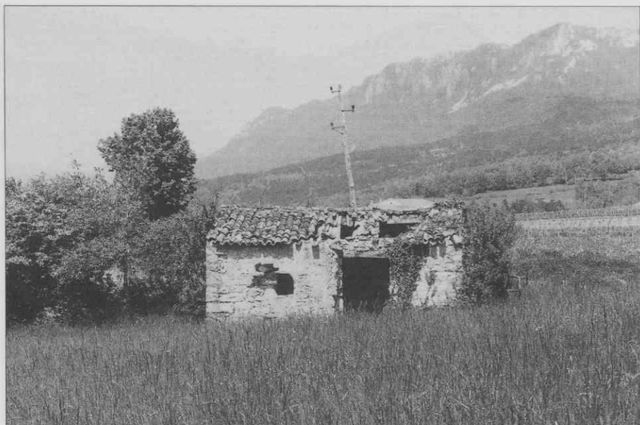
Budanje - opuščena gruntna bajta (foto A. Ščukovt, 1996). ♦ Budanje - abandoned cottage (photo A. Ščukovt, 1996). ♦ Budanje - maisonnette abandonnée (photo: A. Ščukovt, 1996).

odprtini, ki sta tako kot vratna, obdani s kamnitim okvirjem. Oprema je lesena klop z mizo. Del prostora v teh zavetiščih je bil namenjen tudi za živino. Tu so imeli največ po par volov. Vole so rabili za oranje vinograda in da so delali gnoj oziroma za gnojenje.