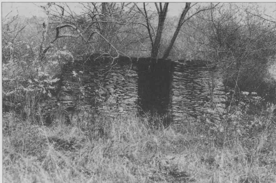
Orehovica - zavetišče v dolini Pasjega repa (foto A. Ščukovt, 1996). ♦ Orehovica - shelter in the Pasji rep Valley (photo A. Ščukovt, 1996). ♦ Orehovica - abri dans la vallée de Pasji rep (photo: A. Ščukovt, 1996).

Najbolj razširjena oblika strehe je dvokapna streha. Kritina je korčna. Imamo pa tudi več primerov vinogradniških zavetišč z enokapno streho. V zadnjih desetletjih uporabljajo za kritino zavetišč tudi salonit in valovito pločevino. Ti dve obliki kritine delujeta na tej zvrsti dediščine in v vinogradniški krajini zelo grdo in nenaravno.