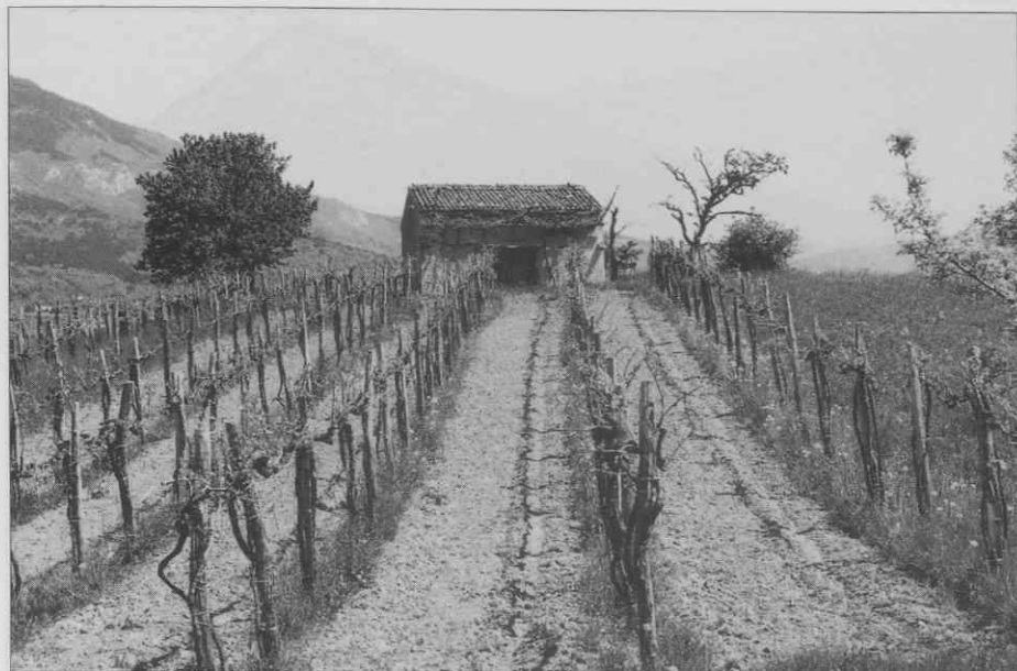
Duplje - gruntna bajta pri Vrhpolju. ♦ Duplje - cottage near Vrhpolje. ♦ Duplje - maisonnette près de Vrhpolje.

že popolnoma zaraščeno in pozabljeno zavetišče ponovno odkriti. Brez njih bi nekatera zavetišča ostala nedokumentirana, predvsem na območju Pasjega repa pri Podnanosu.