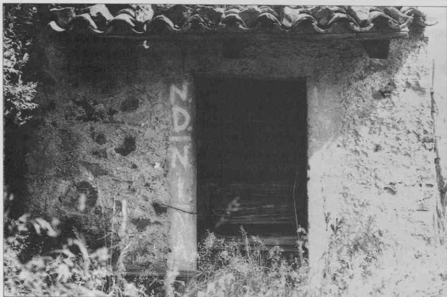
Slap - zavetišče pod Sv. Pavlom (foto A. Ščukovt, 1996). ♦ Slap - shelter under St Paul's (photo A. Ščukovt, 1996). ♦ Slap - abri au-dessous de St. Paul (photo: A. Ščukovt, 1996).