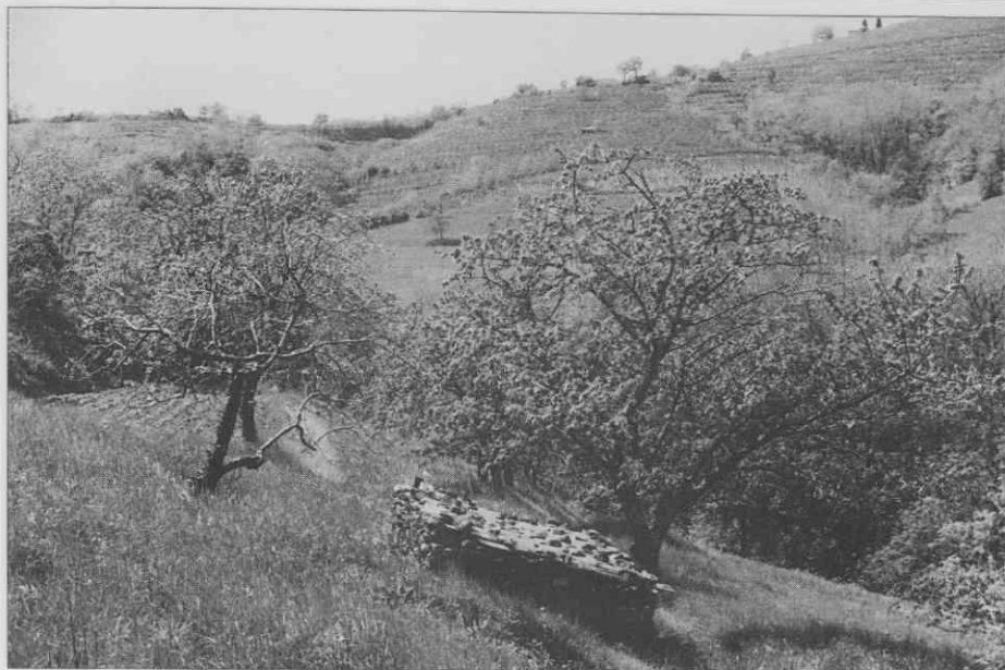
Goče - zavetišče pred vasjo in vinogradniška krajina Goč. ♦ Goče - shelter in front of the village and view of the vineyards of Goče. ♦ Goče - abri près du village et les vignobles.

vinogradniška zavetišča so bila vedno tako velika, da se je v njih odrasel človek lahko ulegel na tla diagonalno. Povprečne dimenzije zavetišč tega tipa so cca 3m x 2.50m in višine 1.60m ali 3.90m x 2.60m ter višine 2.50m.