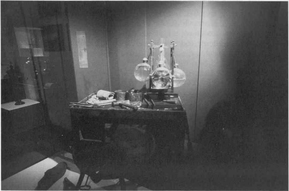
“Šuštarška luč” v okolju čevljarke delavnice. (Foto B. Župančič, 1996)

njihovega preoblikovanja za današnje rabo. Svetlobo in temo osvetli z 184 svetlobnimi telesi, ki jih razvrsti zelo premišljeno po funkciji in tipologiji, glede na gorivo kot primarni kriterij. Časovni vidik izrazi na simbolni ravni že v prvi dvorani, kjer izpostavi čelešnik na eni in žarnico pred ogledalom na drugi strani razstavnega prostora. Na ta način postavi nasproti sodobni električni razsvetljavi enega od najstarejših razstavljenih predmetov. Srednjeveški čelešnik ne vzbuja pozornosti le zaradi svoje starosti, temveč tudi zaradi antropomorfne oblike in dejstva, da je razstavljen prvič v svoji domovini.