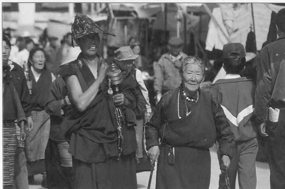
Tibetanski romarji na Barkhorju v Lhasi ♦ Tibetan pilgrims on Barkhor in Lhasa ♦ Pèlerins tibétains à Barkhor en Lhasa

Budizem na Kitajskem in Japonskem razlikuje od tibetanskega budizma Mongolov. Avtor opiše vodjo tibetanskih budistov dalajlamo in njegove namestnike v večjih krajih, ki jim pravijo "kutuktu". V mestu Urga stanuje kutuktu v palači, poleg katere je budistični tempelj, posvečen bogu "Majdar", kjer prebiva 10 000 lam. Le-ti prerokujejo srečo, prižigajo luči pred podobami bogov, zažigajo kadila, s praznovernimi obredi preganjajo bolezni in za taka opravila dobivajo različna darila. Tempelj, romarje in lame v njem opisuje zelo natančno. Opiše tudi "čuden prizor": Mongoli so pisali svoje prošnje na papir, papir dajali v usta, ga prežvekovali in mokre kroglice metali naravnost v malika. Prošnja naj bi bila uslišana le, če se je kroglica prijela malikove podobe. Med opisovanjem budizma avtor ponovno omeni tibetanski budizem oz. lamaizem. Naši junaki so namreč s Kitajske prišli na Japonsko in ob slovesu z Japonsko oz. budizmom avtor v zadnjem odstavku poglavja piše: "Budovi nauki so zbrani v knjigi, ki ji pravijo "Kandžur". Tiskana je v tibetanskem in mongolskem jeziku in obsega 108 zvezkov. Vsak zvezek ima 10.000 strani, je debel 22 cm in tehta 4 kg. To je največja knjiga na svetu."