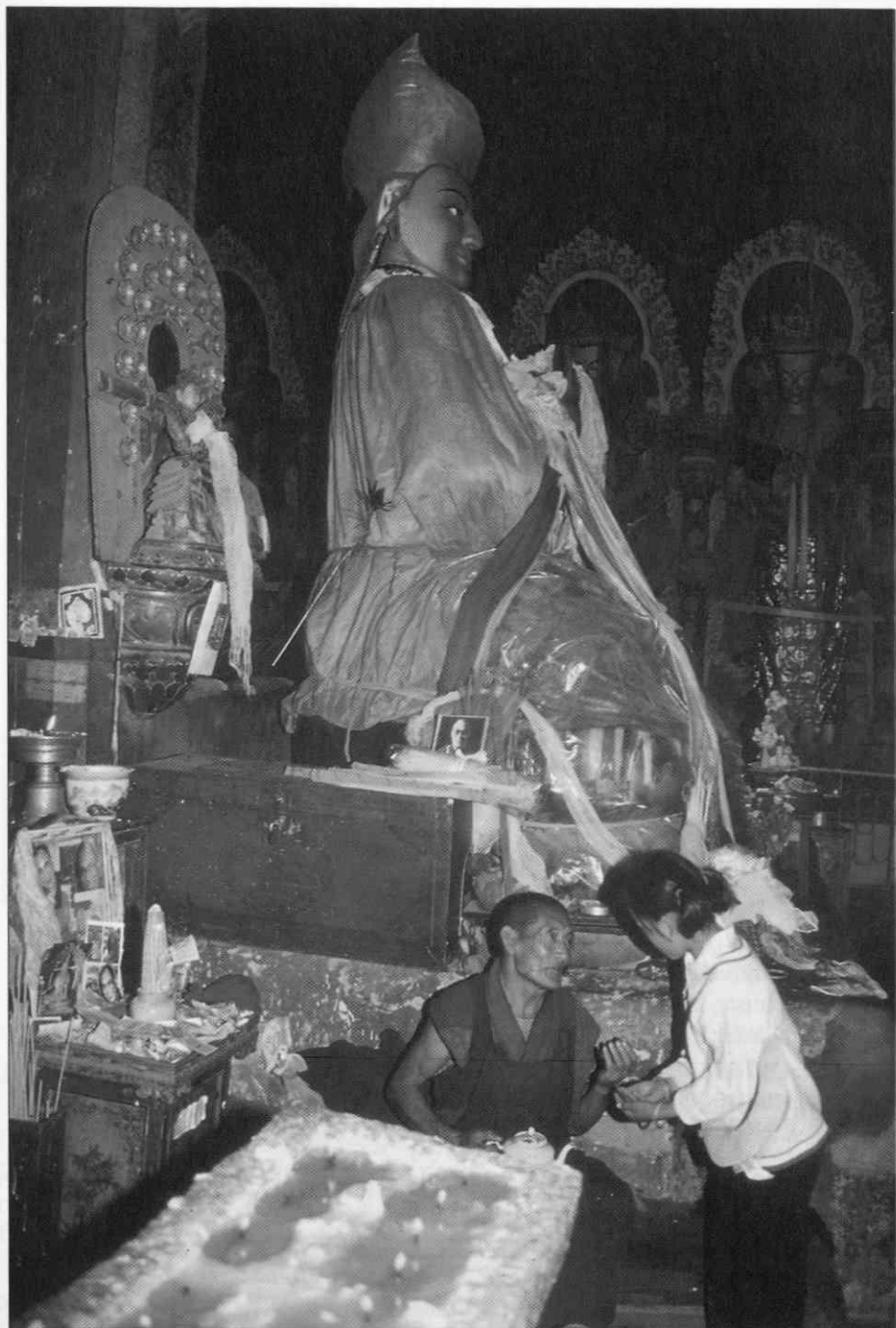
Tsongkhapa, utemeljitelj sekte Rumenih kap, Drepung, Lhasa (Foto Ralf Čeplak Mencin, 1994) ♦ Tsongkhapa, the founder of the Yellow Caps Sect, Drepung, Lhasa (Photo Ralf Čeplak Mencin, 1994) ♦ Tsongkhapa, fondateur de la secte des Bonnets jaunes, Drepung, Lhasa (Photo faite par Ralf Čeplak-Mencin, 1994)