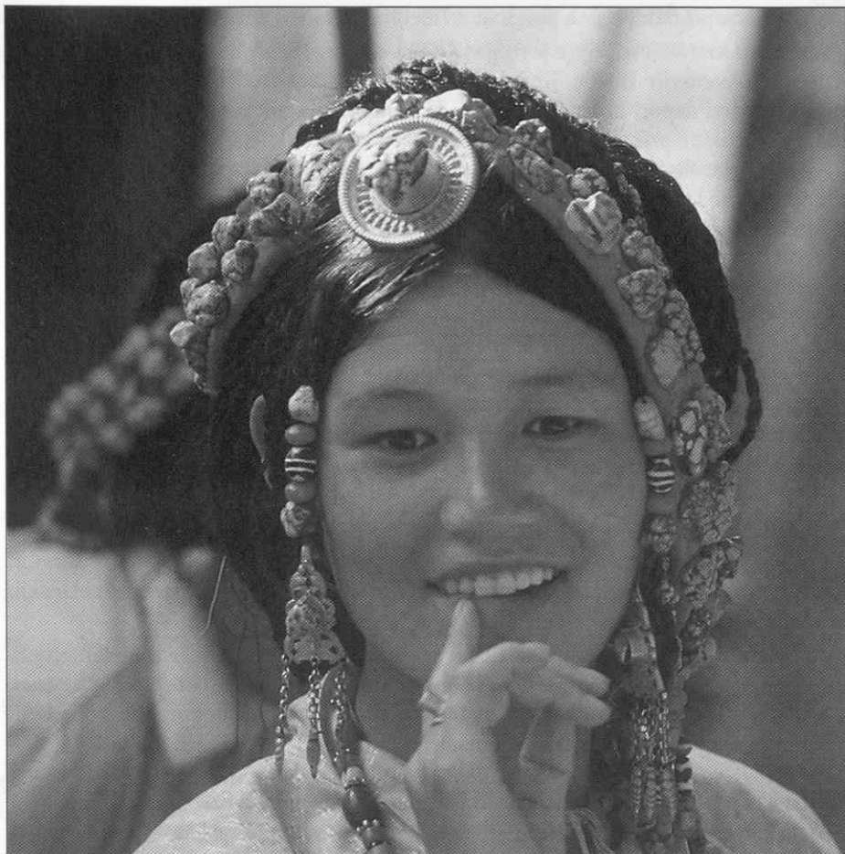
Tibetanka iz province Kham (Foto Ralf Čeplak Mencin, 1994) ♦ Tibetan woman from the province of Kham (Photo Ralf Čeplak Mencin, 1994) ♦ Une Tibétaine de la province de Kham (Photo faite par Ralf Čeplak-Mencin, 1994)

avtorjev, vendar skuša podati dokaj objektivno sliko verstev sveta.