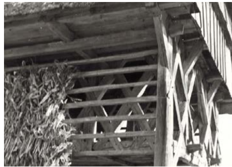
Primeri iz naloge prvega sklopa iz študijskega leta 1970/71 (avtorica Katka Braz)

Drugi sklop nalog vsebuje ideje za izboljšave kozolca oz. ideje za moderni kozolec. Naloge so oštevilčene s številkami od 1 do 58, a jih pet manjka. Za razliko od nalog v prvem sklopu so bile te vse narejene zgolj v študijskem letu 1970/71. Večina imen njihovih avtorjev se pojavi tudi v prvem sklopu, tako da so, kot kaže, študentje v študijskem letu 1970/71 morali izdelati dve nalogi (posnetek kozolca v naravi in futuristični kozolec), v kasnejših študijskih letih pa samo še eno (posnetek kozolca v naravi). Med idejami v tem sklopu so tudi montažni (modularni) kozolec iz plastike, ki ga je mogoče prestaviti in poljubno podaljšati, kozolec v obliki silosa ali spirale, armiranobetonski kozolec itd.