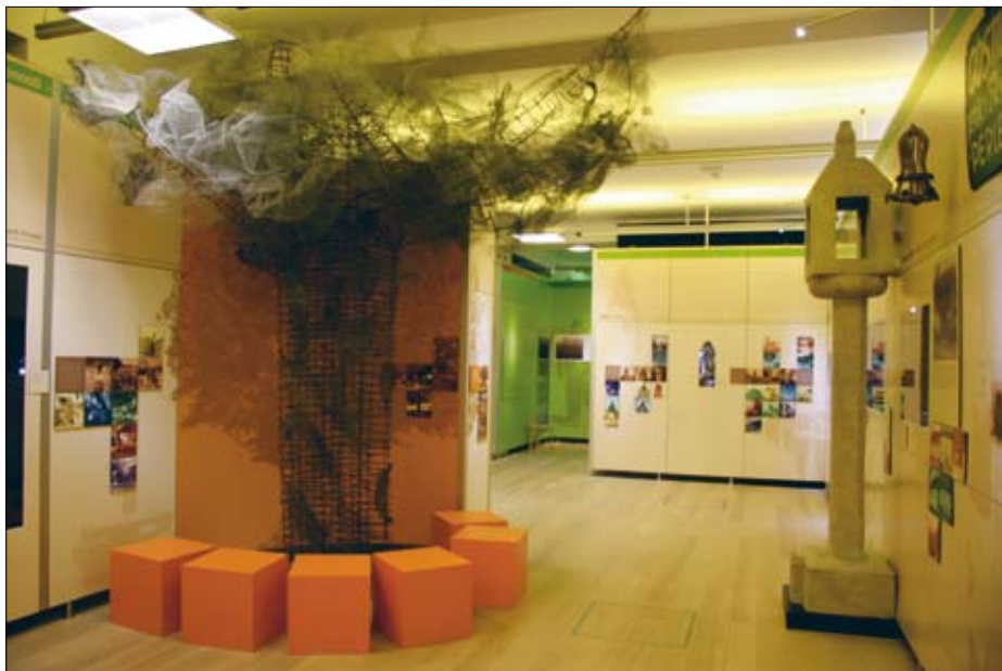
Razstavni prostor ( Moja skupnost – moj domači kraj ) z mrežastim drevesom, ki simbolizira točko zbiranja, posvetovanja in odločanja o skupnih zadevah; prostor močno vizualno opredeljuje tudi izpostavljena mavčna kopija kamnitega “farala” (svetelnika), ki opominja na pomen skupnega spomina in njegovega opredmetenja za identifikacijo s krajem, njegovim časom in ljudmi.

že omenjena analogija, pa kot asociacija združevanja narave in kulture, pojavnega in simbolnega. Je tudi del razstavne rdeče niti Pot Enega , kjer simbolizira življenje skozi letno cikliranje.