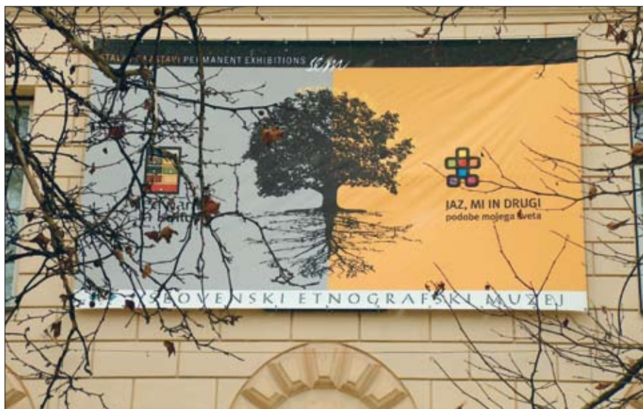
Grafično združevanje dveh stalnih razstav in njunih različnih principov v enotnem simbolnem motivu drevesa; na vsaki strani drevesa sta nameščena naslova in označevalna loga razstav. Transparent na stranski muzejski fasadi.