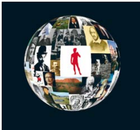
David kot simbol slehernika na mozaični podobi Zemlje: grafični zaključek animirane vsebine v zaključnem poglavju razstave je vizualni povzetek ideje o kreiranju subjektivnega videnja sveta in individualnih težnjah po umeščanju vanj.