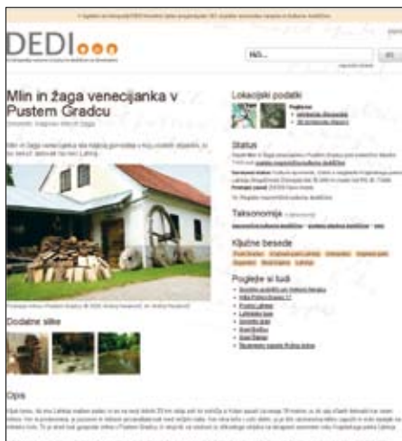
Slika 3a: Osnovna dediteka