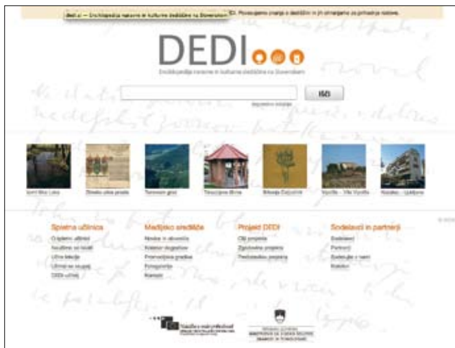
Slika 1: Vstopna točka v spletno mesto DEDI