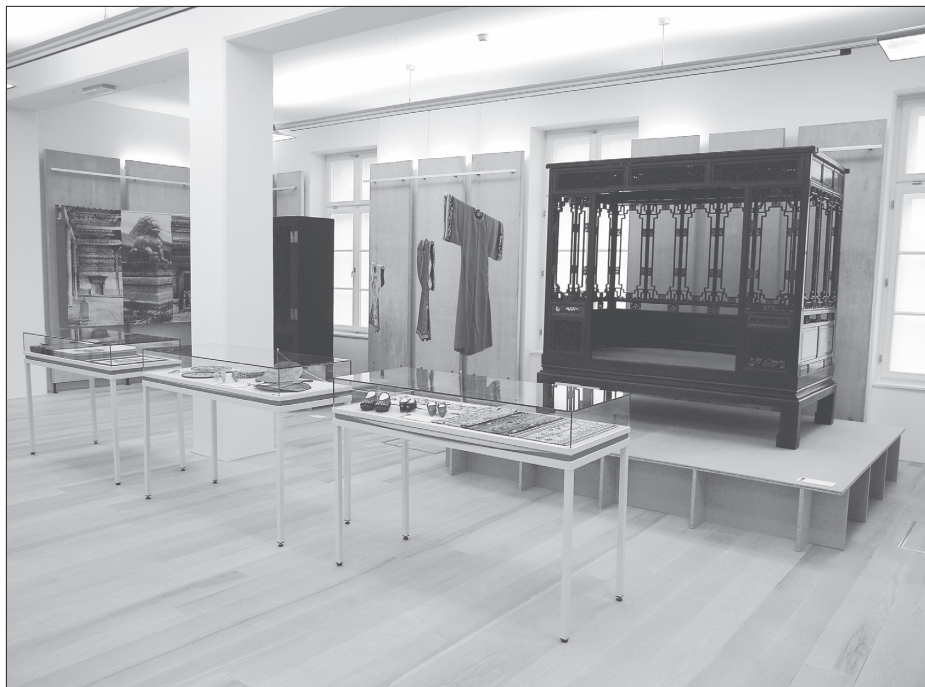
Razstava Srečevanja s Kitajsko . Foto: Marko Habič, 2006