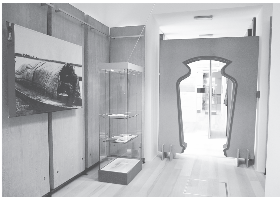
Razstava Srečevanja s Kitajsko . Foto: Marko Habič, 2006