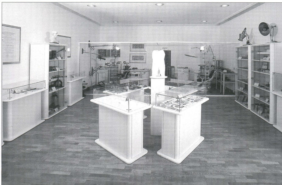
Slovenska zobozdravstvena zbirka v Muzeju novejšje zgodovine Celje

Muzeološko je predstavitev zobozdravstvene zbirke zasnovana tako, da sta najprej predstavljeni dve kompletni zobozdravstveni ordinaciji, v tehničnem delu pa zobozdravstveni in zobotehnični instrumenti ter pripomočki.