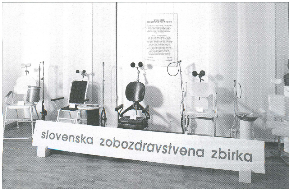
Zobozdravstveni stoli skozi čas

zgodovine Celje dolgoročno posodil 14 zobozdravstvenih eksponatov iz obdobja 1930-1960, saj sta ga impresionirali velikost in pestrost zbirke.