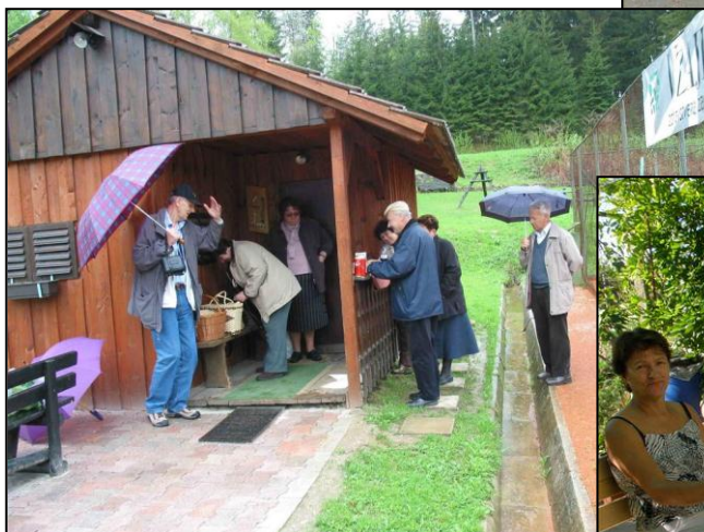
Počitniško druženje na Krku, 2012 Malica pod šupo, Kotlje, 2006