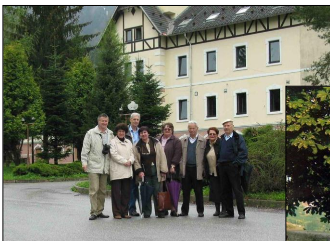
Rimski vrelec, 2006 Goriška Brda, 2008