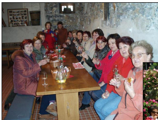
Skupinska slika iz zidanice v Beli krajini Med dišečimi burbonkami