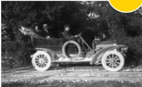
V fotografski objektiv je ujel tudi prvi avto, ki se je leta 1910 pripeljal v Šmarci pri Kamniku.

»Poglej, poglej, tole je Čopova ulica v Ljubljani! Gradijo tramvajsko progo.« je z začudenjem opazovala črno-belo fotografijo obiskovalka v Slovenskem etnografskem muzeju (SEM), ko so v četrtek odprli razstavo fotografij Petra Nagliča, ki zagotovo kažejo neponovljiv izsek časa, ki se danes ohranja le še v zgodovinskih učbenikih in literaturi. A slikovno, prek predstavitve vsakdanjih dogodkov, napredka gradnje tistega časa, ga je mogoče