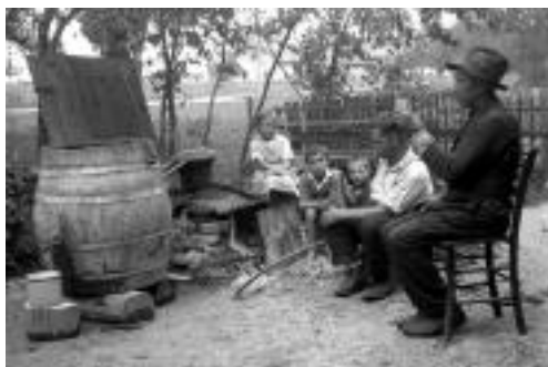
Portretne fotografije odsevajo življenje tedanjega časa, ko so se mnogi ukvarjali tudi s kuhanjem žganja.