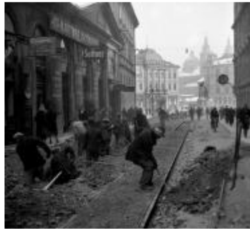
Podoba Čopove ulice v Ljubljani, ko so postavljali tramvajsko progo.