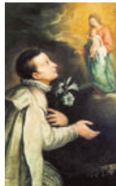
Sveti Alojzij Gonzaga