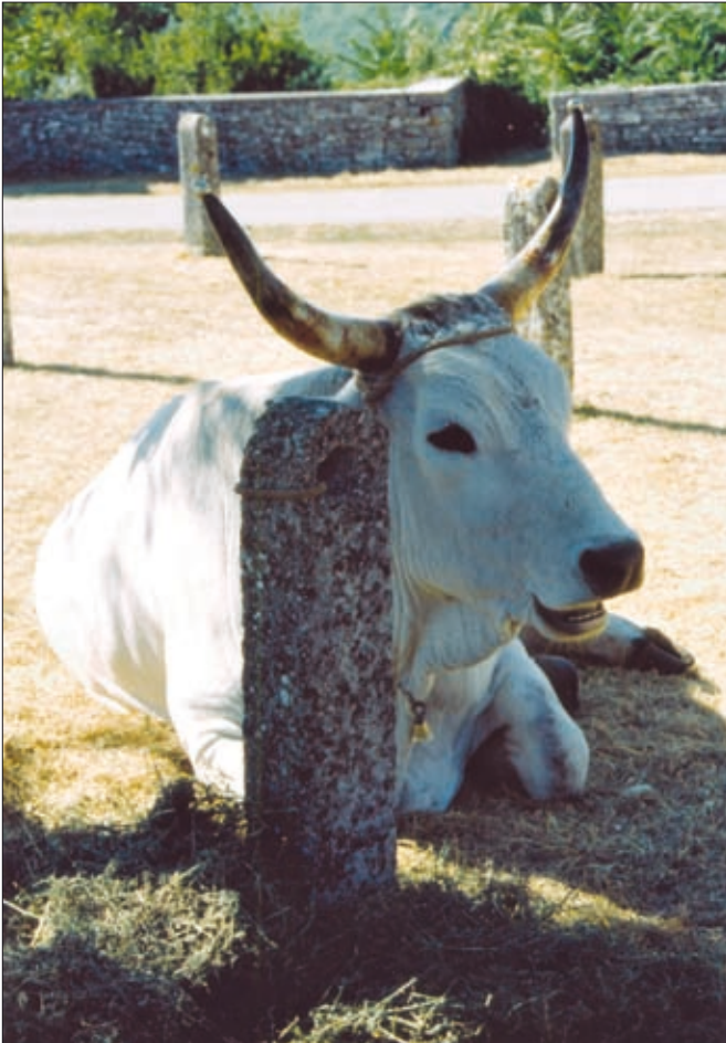
Istrski vol, žival ene izmed najbolj ubogljivih in vzdržljivih delovnih govejih pasem.

se je porajala “filozofija stvarnosti vsakdanjega življenja”, namreč pomeni eno samo, mikavno zanikanje akademskega filozofskega dualizma v medsebojnem razmerju človek – žival. V vsakdanji bližnjosti so bili voli v besedi in v pomenu nemalokrat enačeni z ljudmi, o čemer zgovorno pričajo naslednji stavki: “Kakšen vol je bil tudi bolj živ – kakor človek.” – “Je bil bolj pameten kot človek.” – “Se je bilo treba pogovarjat z volom kot z