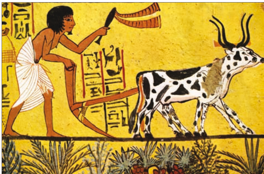
Upodobitev biča oziroma biču podobnega (zvočnega) orodja, morda najzgodnejša te vrste, iz groba v Tebah, okoli 1200 pr. n. št. (iz: Arpag Mekhitarian, Ägyptische Malerei , Genève 1954 (Skira), str. 149).

Preden se dotaknemo tleskanja ali pokanja z bičem kot pomenskih zvokov, ki so tu in tam spremljali melodijo glasov delovnih velelnic in volovskih imen, velja omeniti še eno sestavno sporazumevanja z delovnimi voli – rožljanje z vprežnimi verigami. Kakor kaže, je imelo slednje dva pomena. Posamezniki se spominjajo, da so ga živali