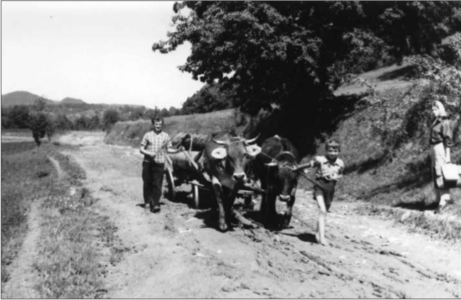
Fantič iz Homa na Dolenjskem stopa pred volovsko vprego in vodi vprežena vola (foto: Fanci Šarf, 1961).