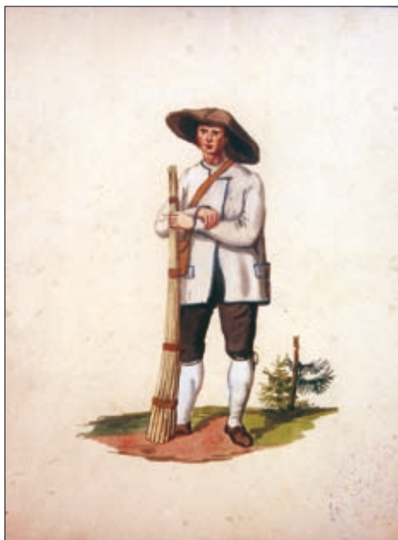
Goldensteinova upodobitev možaka iz Skopega pri Komnu na Krasu s šopom bičevnikov v roki, iz leta 1838 (Dokumentacija SEM).