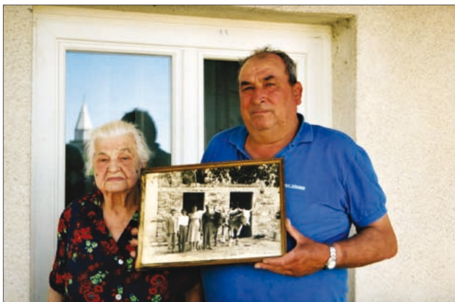
“ To je pa naša familija. ” so bile besede vdove volarja iz Sv. Antona nad Koproj v slovenski Istri, ko mi je spregovorila o okvirjeni fotografiji v jedilnici, na kateri sta oba z možem, njuna sinova in oba domača vola (foto: Inja Smerdel, 2007).

O bližnjosti vola in kmeta ter prepletenosti njunih življenj še posebej mikavno priča njuno medsebojno sporazumevanje, ki je bilo nepogrešljivo za ubrano delovno tovarištvo. V njem so prav vsi čuti igrali svojo vlogo: okus, voh, tip in sluh. Pričujoči prispevek se suče zlasti okoli slednjega, saj so bili človeški glas – govorjene ali pete besede in medmeti –, zven žvižga in pok biča nepopisno učinkovita nesnovna orodja v okviru živinorejskih tehnik. V teh tehnikah z rabo maloštevilnih orodij, v delovnih opravilih