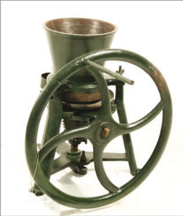
Mlin za barve. Metlika. Zbirka SEM