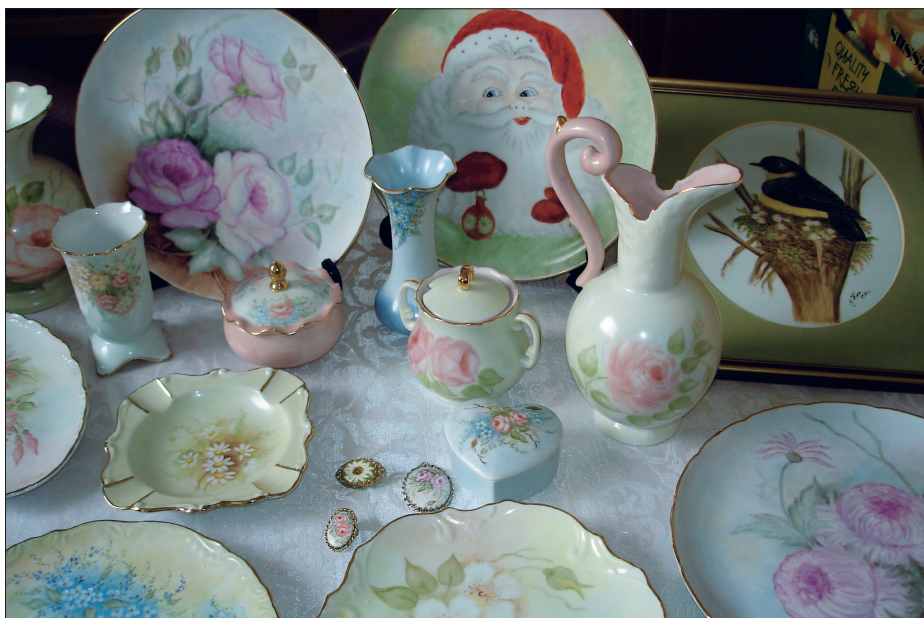
Izdelki iz porcelana, ki jih je izdelala in ročno poslikala Julijana Kure. Foto: Daša Koprivec, Geelong, maj 2006.