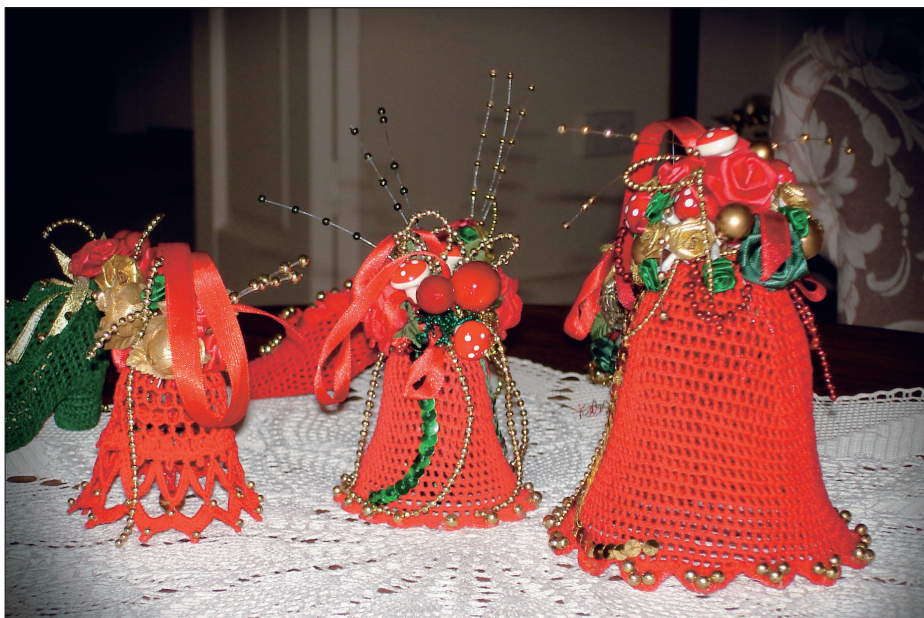
Božični zvončki iz tekstila, ki jih je izdelala Anica Kodila. Foto: Daša Koprivec, Melbourne, maj 2006.