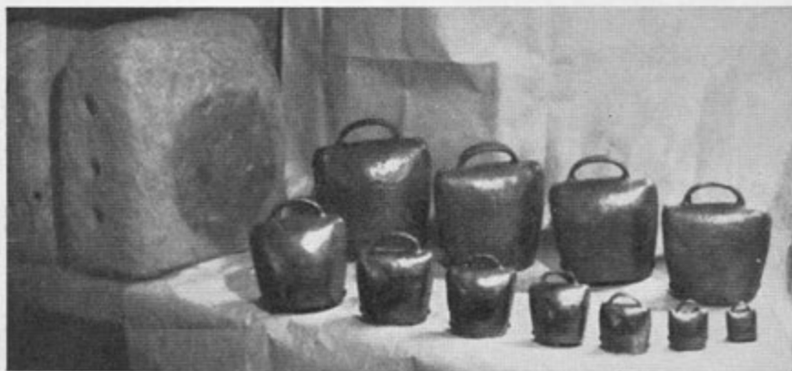
Sl. 4. Pušlja in gorjanski zvonci različne velikosti (foto B. Orel, 1950)