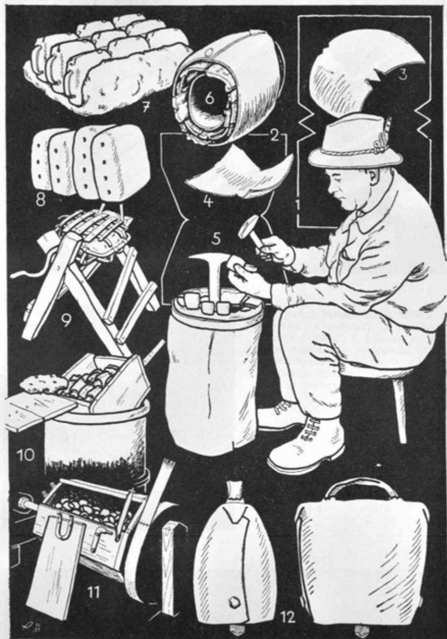
Sl. 1. Iz zvončarstva na Višelnici pri Gorjah: 1.—2. pločevinasti ploščici z zobom in brez njega, 3.—4. z bokanjem spremenjena oblika teh ploščic, 5. po bokanju zaviljuje zvončar na »šperaki« oba dela ploščice v obliko zvonca, 6. za lotanje vložijo več zvoncev razne velikosti drugega v drugega, 7. iz tako zloženih zvoncev napravijo tri vrste na ilovnati plasti, 8. vrste zvoncev zaviljuje v ilovnat »pušl«, 9. »valavka« ali »valavonca«, kjer vrte pušel po lotanju, 10. odprta »mišonca« z zlatanimi zvonci na čeburu vode, 11. »drumla« za čiščenje zvoncev, 12. gorjanski zvonec z dveh strani (risal I. Romih)