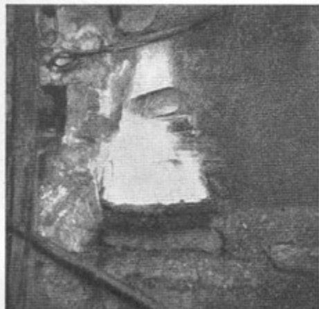
Sl. 3. Na ješi se na ognju pečejo pušlji (dva zakriva ogenj, tretji — na mačku — je dobro viden)